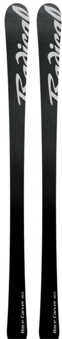
Race Carver Speedcarving/Carving Längen: 165, Neue Länge: 170