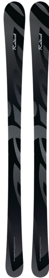
Allmountain Allmountain/Carving/FR Längen: 155, 165, 175