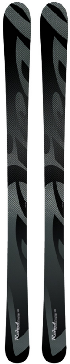
Freerider Allmountain/FR/Carving Längen: 177, 184, Neue Länge: 168