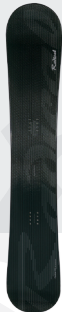
Faster FR/Extreme/Carving 166, 174